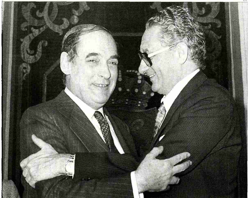
Antonio Fontán (izq.), en 1977, junto al entonces secretario de la Cámara Alta, José Federico de Carvajal

La clase política se deshizo en halagos con el político desaparecido. Pero fueron las palabras del actual presidente de la Cámara Alta, Javier Rojo, las que más sentido tenían en un día como el de ayer. «La democracia española debe reconocer a Fontán su trabajo y sus esfuerzos para que España sea hoy el gran país que es. Ese es el legado que deja un hombre bueno como fue Antonio Fontán». De este modo, Rojo despedía a su predecesor y maestro, aquel que ocupó su asiento hace más de treinta años.