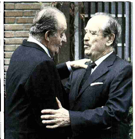
El Rey se despidió de la ramiella tras dar su último adiós al primer presidente del Senado